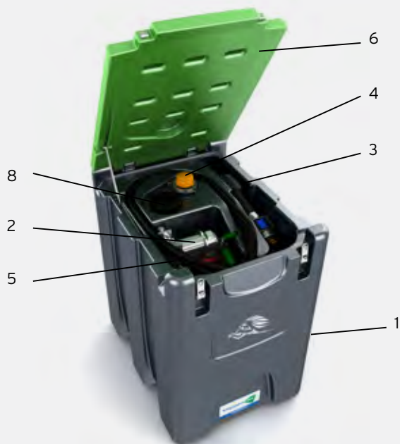
TruckMaster® 300 I