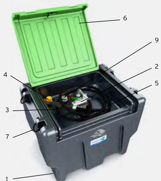
TruckMaster® 430 I